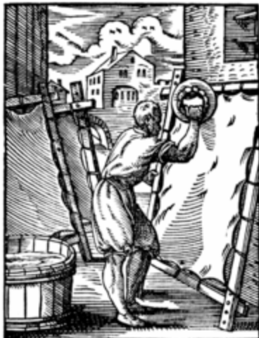
Pergaminho alemão, 1568

adaptado de: Wikipédia, a enciclopédia livre.