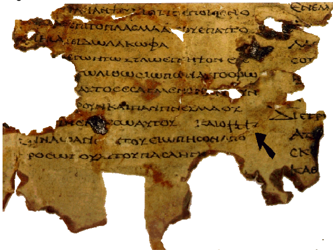
Fragmento da Septuaginta, do Século I, a.D.