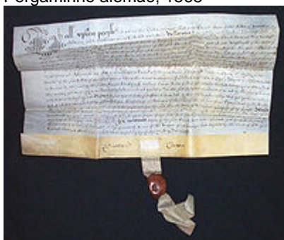
Velino de 1638.

Pergaminho (do grego pergaméne e do latim pergamina ou pergamena ), é o nome dado a uma pele de animal, geralmente de cabra, carneiro, cordeiro ou ovelha, preparada para nela se escrever. Designa ainda o documento escrito nesse meio. O seu nome lembra o da cidade grega de Pérgamo, na Ásia Menor, onde se acredita se possa ter originado ou distribuído.