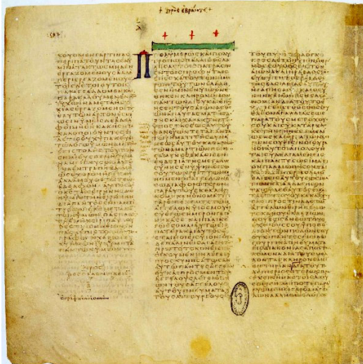
Página do Codex Vaticanus contendo II Tessalonicenses 3.11–18 e Hebreus 1.1–2.2.